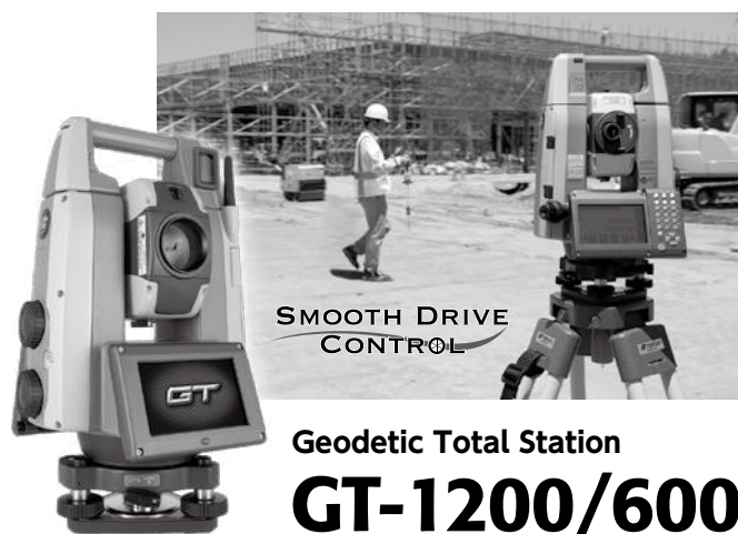
Geodetic Total Station GT-1200/600 シリーズ