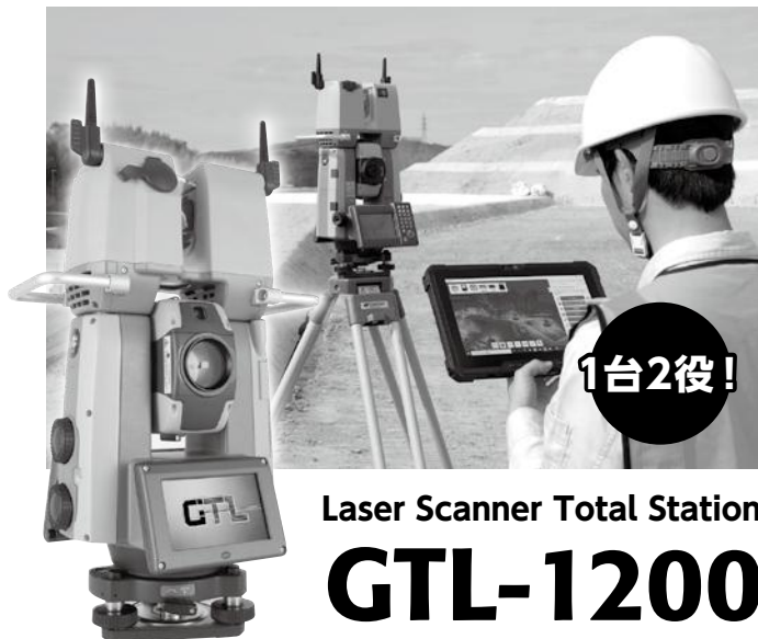
Laser Scanner Total Station GTL-1200