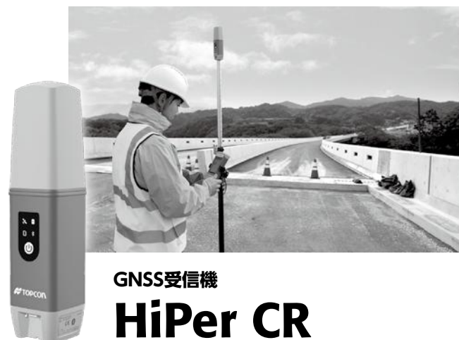
GNSS受信機 HiPer CR