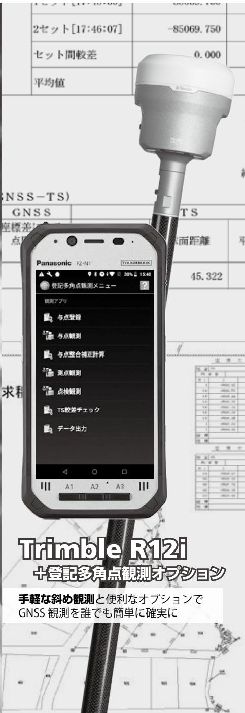
Trimble R12i +登録多角点観測オプション